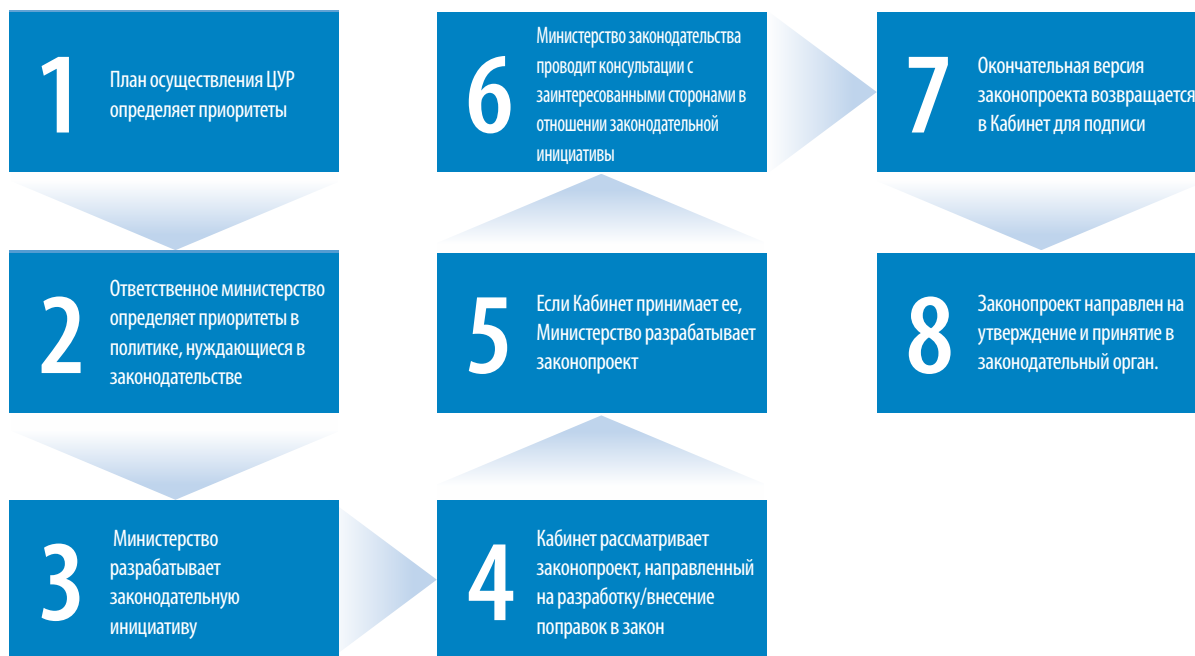
Диаграмма X Основной процесс разработки законопроектов и поправок к законам