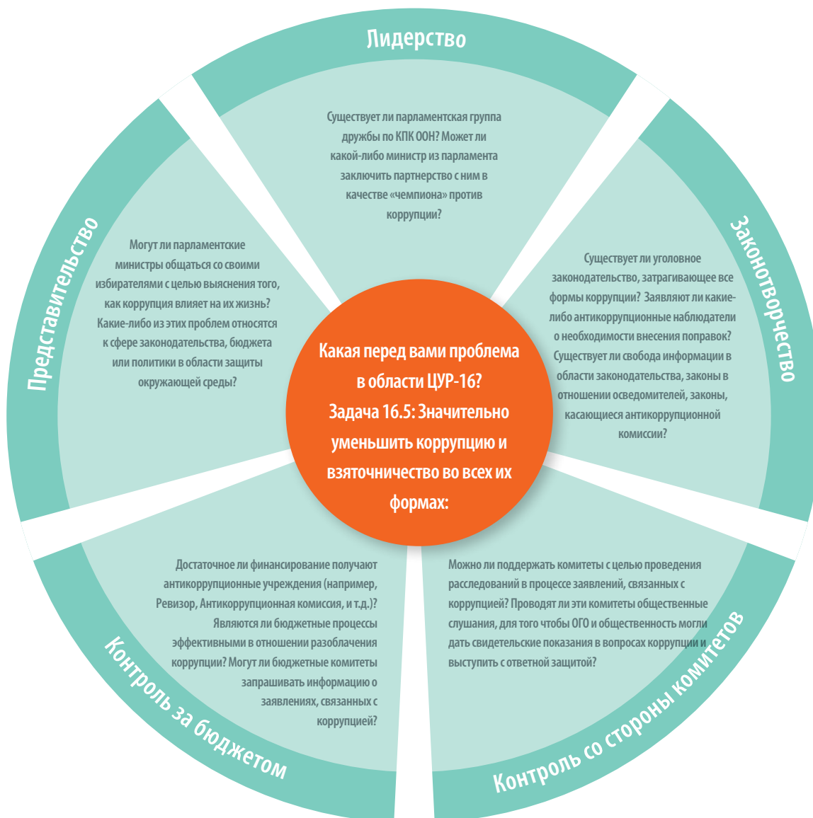
Диаграмма 2: Вводные положения для работы с законодательными органами